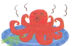
日間賀島名物 たこの丸茹で